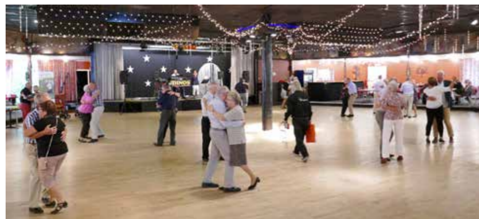
En tryckare tycks det!