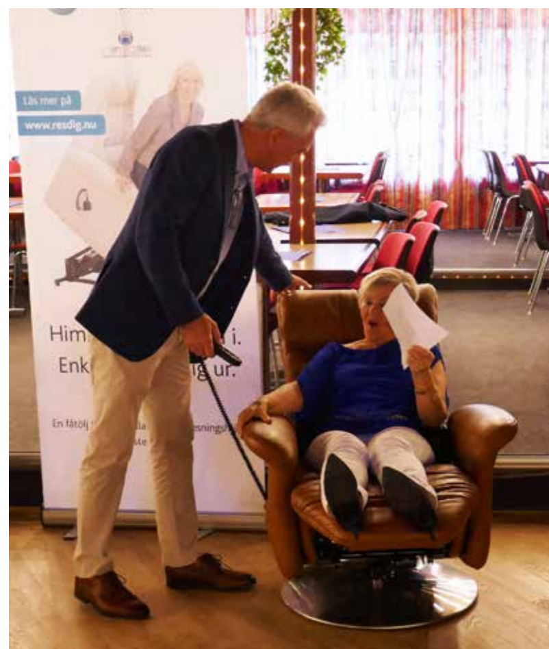
En vilopaus, kanske?