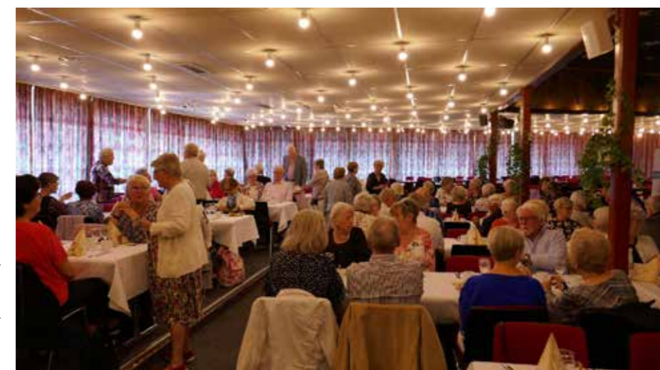
Nu har vi satt oss till bords!

Festdagen blev en lyckad dag, tyckte vi på avd. 10. Även gästerna tyckte allmänt att dagen blev väldigt lyckad.