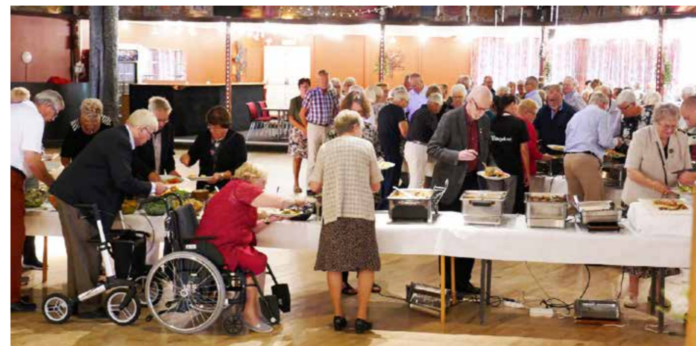
Så var det dags för "Madaboret"