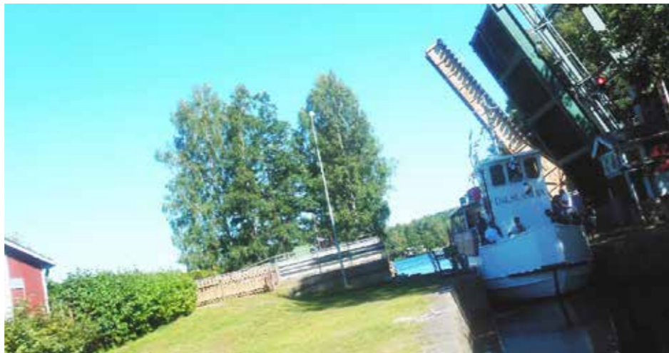
Embarkering för kanalfärden

Sedan blev det dags att åka kanalbåt, som utgick från Långbron. På denna turen fick vi uppleva en mycket vacker sjöväg med lunch. Båtturen slutade efter den världsberömda akvedukten i Håverud.