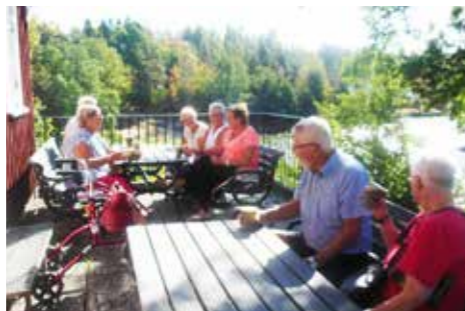
Kaffepaus vid Skålleruds kyrka

Tredje dagen åkte vi en bit norr ut för att göra ett besök på Halmens Hus i Bengtsfors samt åt en mycket god lunch på Baldersnäs herrgård, (ungns kokt torsk).