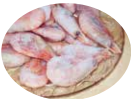
Räkafton på "Kollo" 31 augusti

Det blev ingen ny bild Utan det blev fjorårets rä- kor. Hoppas de smakade bra ändå.