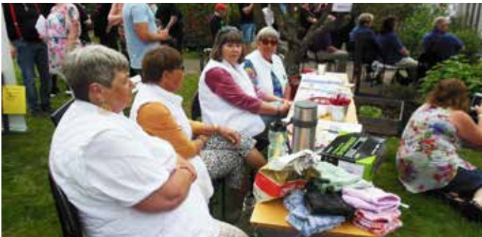
Ut i det "blå" den 5 juni I år blev det Karlskrona